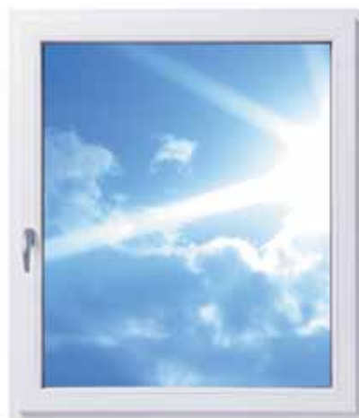
Ein Fenster mit Roto NT Designo und völlig verdeckt liegenden Bändern

Und obendrein spart man Zeit bei der Fensterreinigung. Roto hat diesen verdeckt liegenden Beschlag mit seiner eleganten, mattsilbernen Oberfläche neu entwickelt. Für schöne Holz- und Kunststoffenster, die hohen Komfort, exklusives Design und zahlreiche Gestaltungsmöglichkeiten bieten.