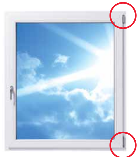
Ein herkömmliches Fenster mit sichtbaren Bändern