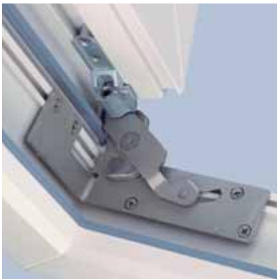
Einfache Justierung der Fensterflügel Über Verstellerschrauben lassen sich die Fensterflügel dreidimensional einstellen

Alle Bauteile sind von außen unsichtbar im Fensterrahmen und -flügel integriert. Die Fensterflügel lassen sich über Verstellerschrauben dreidimensional einstellen, was die Justierung vereinfacht. Die Falzluftverstellung erfolgt über das Eckband und den Axerstulp. Wartungsarm: Spezielle Fettdepot-Taschen sorgen für eine Dauerschmierung der Laschen und reduzieren den Verschleiß.