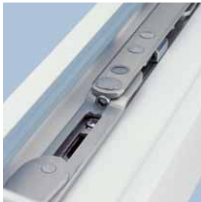
Von außen unsichtbar Alle Bauteile sind im Fensterrahmen und -flügel integriert

Die komplette Bandseite wird verdeckt montiert. Alle Verstellungen sind mit nur einem 4er-Inbusschlüssel durchführbar, Verstellreserven durch eine Skala am Eckband optisch sichtbar. Neue, im eingebauten Zustand unsichtbare Kraftableitungen ermöglichen kleine, kompakte Bauteile. Vorteil: Kurze Montage- und Anschlagzeiten.